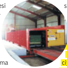
Prevac ön koruma tesisi

Özellikle yapı ahşabı için geliştirilmiş ön koruma işlemleri, onarım amaçlı koruma işlemleri ve üst yüzey işlemleri konusunda uzman olan Senkron,