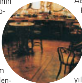
Henry's Café, London

ULTRADEC 8331 , bu markanın, tek bileşenli poliüretan ahşap zemin cilasıdır. Nem kurlanmalıdır. Polimerizasyon havadaki nem ile oluşur. Diğer nem kurlanmalı poliüretanların uygulanmasında büyük problem olan havanın sıcaklığı ve rutubetten fazla etkilenmez. Aşınmaya son derece dayanıklı olmasının yanı sıra esnektir de. Böylece ahşabın çalması, cilanın çatlamasına neden olmaz.